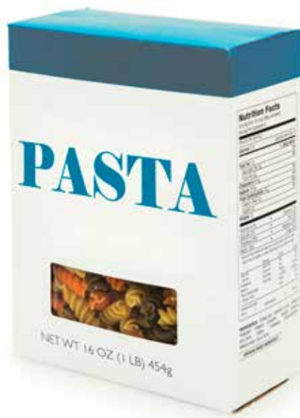
Vooraf voedingsproducten zoals pasta, rijst of graanproducten zijn gevoelig voor de contaminatie.

De minerale oliën in gerecycleerde kartonnen verpakkingen kunnen afkomstig zijn van de inktten die onder meer gebruikt worden in kranten en magazines. Ze worden overgedragen – gemigreerd – naar de verpakte voedingsmiddelen via verdamping. “Al beperkt het probleem zich niet tot primaire verpakkingen uit gerecycleerd karton”, zegt Kurt De Mey. “Migratie kan ook ontstaan uit contact met de secundaire verpakking of door de inkt waarmee de verpakking bedrukt werd.”