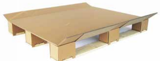
ALLBOX Network Vermijden van verspilling