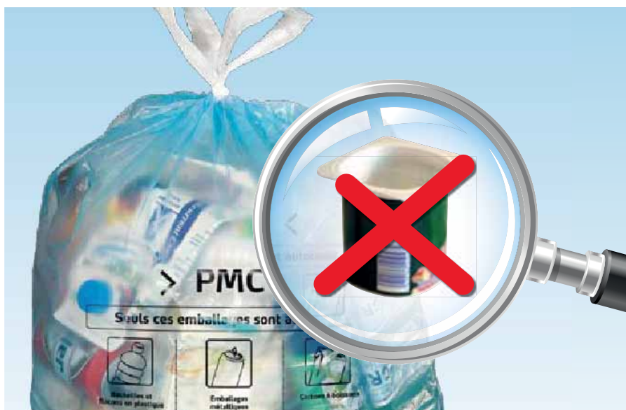
In Brussel, Luik en Antwerpen zette Fost Plus een campagne op om de sorteerkwaliteit van PMD te verbeteren.

daarop de vastgestelde inbreuken. Wie goed sorteert, ontvangt felicitaties. De controleurs registreren alle resultaten met het oog op toekomstige acties. Waar mogelijk worden bewoners van appartementsgebouwen ook rechtstreeks aangesproken door medewerkers van de stad, die hun de nodige uitleg verschaffen over het sorteren van PMD.