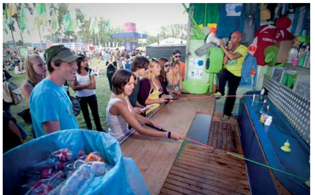
Festivalgangers overtuigen om correct te sorteren, het blijft een uitdaging.