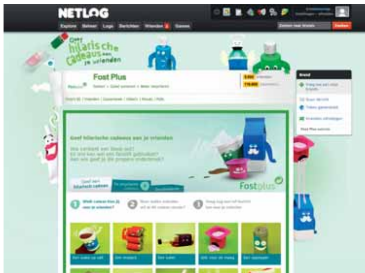
De grafische stijl onderstreept de toon van de actie.

(gelinkt aan een tube tandpasta) of iets voor de maag (gelinkt aan een potje yoghurt)? Deelnemers konden aan hun cadeautje ook een persoonlijke boodschap toevoegen. Op die manier creëerden we een echte dialoog, het magische woord voor dergelijke acties. Op de profielpagina van de deelnemers verscheen ook hun score voor het spel.