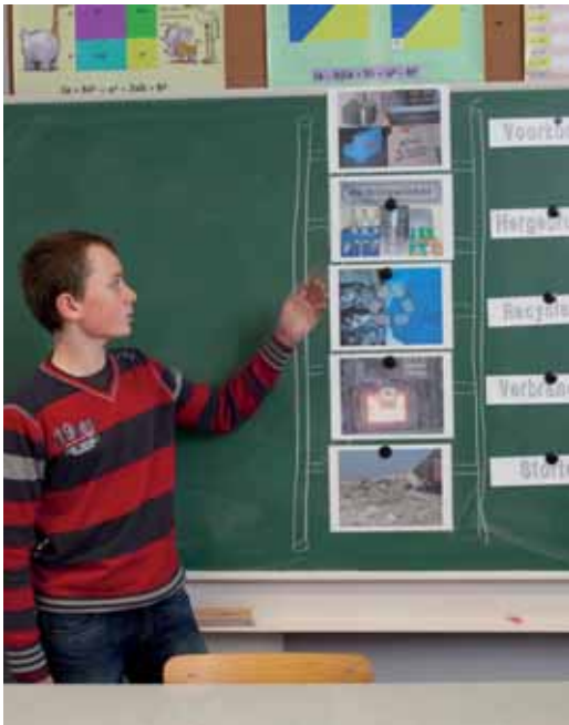
"Wat mag er niet op de composthoop – theezakjes, zand of keukenpapier?" Correct sorteren blijkt niet altijd evident.

Donderdag 23 september 2010, 10.20 uur, de bel gaat. Elf leerlingen van het zesde middelbaar gaan de klas binnen voor een les voedingsleer. Vandaag staat 'Da's proper!' op het programma, een workshop geleid door Green Belgium vzw in opdracht van Fost Plus.