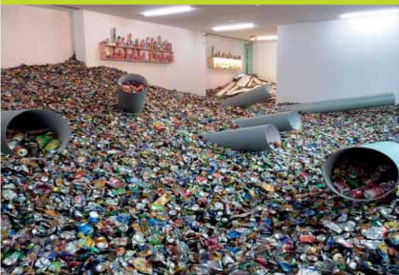
Fost Plus en Indaver leverden de nodige blikjes waarmee Thomas Hirschhorn zijn kunstwerken creëerde.

© Thomas Hirschhorn, foto: André Gordts / Courtesy Museum Dhondt-Dhaenens, Deurle