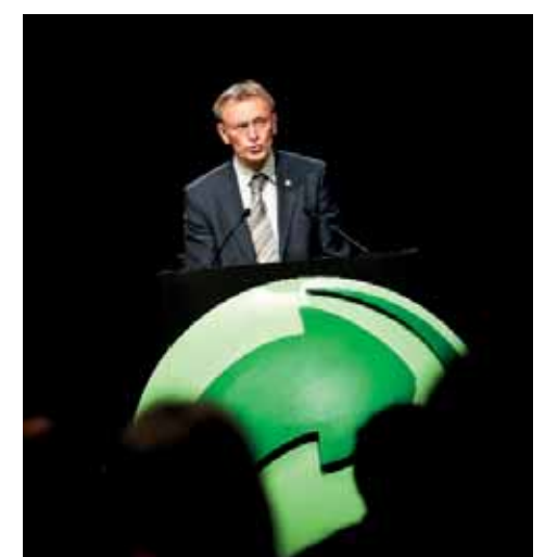
Janez Potočnik: "De eco-industrie moet de motor worden van onze toekomstige groei."

Efficiënt omspringen met resources is trouwens niet alleen noodzakelijk vanuit ecologisch oogpunt, maar ook voor de competitiviteit van de Europese economie. "Europa is immers heel sterk