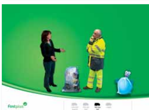
Dankzij de e-learningmodule kunnen PMD-sorteerders snel en efficiënt worden opgeleid via internet.