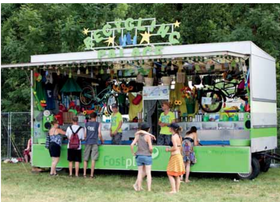
PMD-verpakkingen vissen bleek tussen alle decibels en frieten door een aangenaam en tegelijk leerrijk tijdverdrijf.

In totaal werd deze zomer op de festivalterreinen meer dan 100 ton PMD, papier-karton en glas selectief ingezameld. Het beste bewijs dat de aanwezigheid van Fost Plus wel degelijk het verschil kan maken. Alvast bedankt aan alle aanwezigen, en tot volgend jaar!